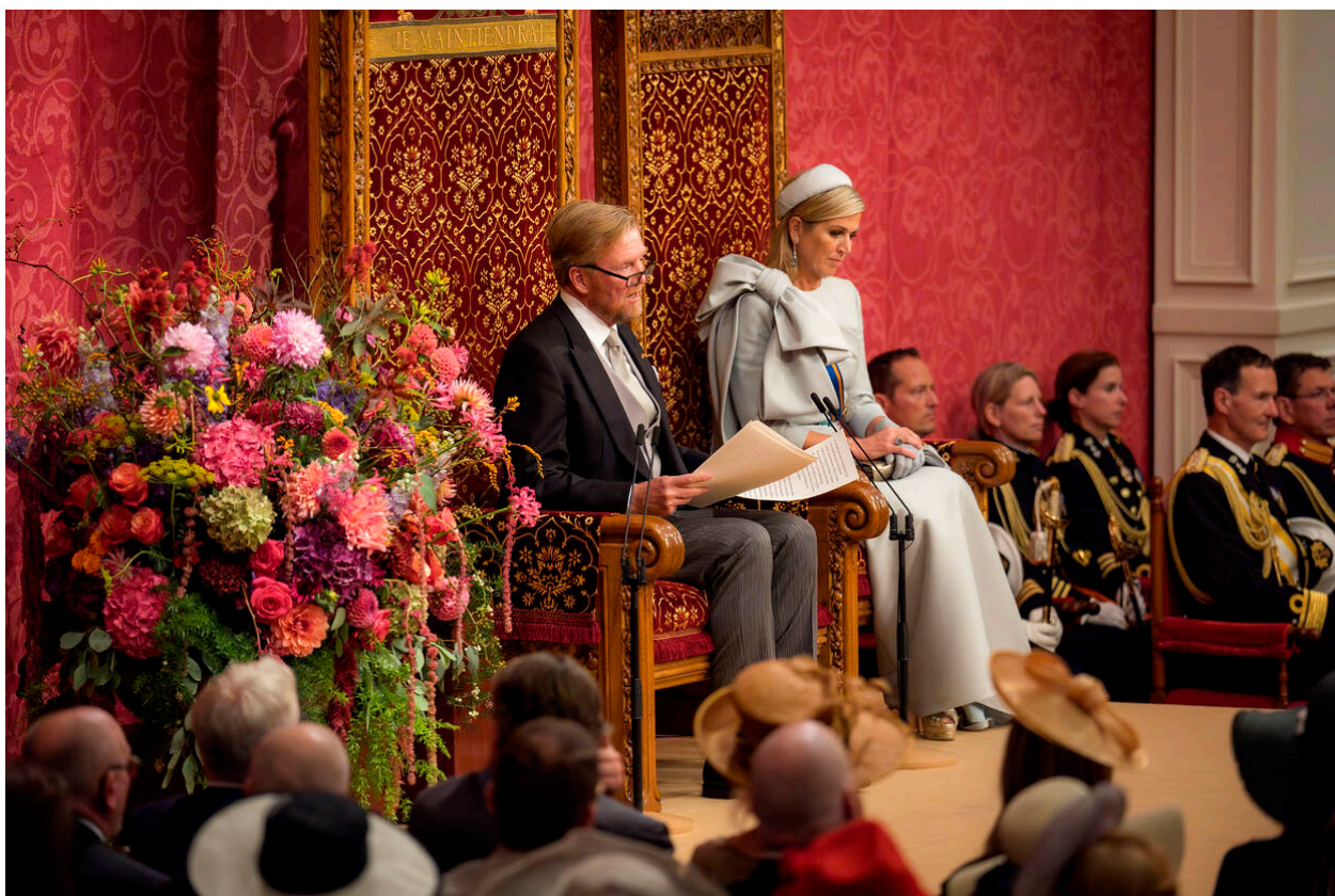
Koning Willem-Alexander leest de Troonrede 2024