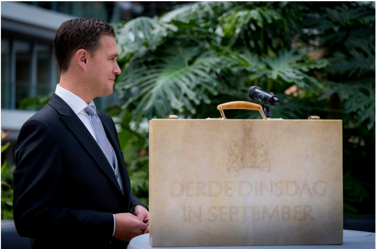
Minister van Financiën, Eelco Heinen

De hiervoor opgenomen cijfers kunnen nog wijzigen tot het Belastingplan 2025 aan het einde van dit jaar definitief wordt vastgesteld.