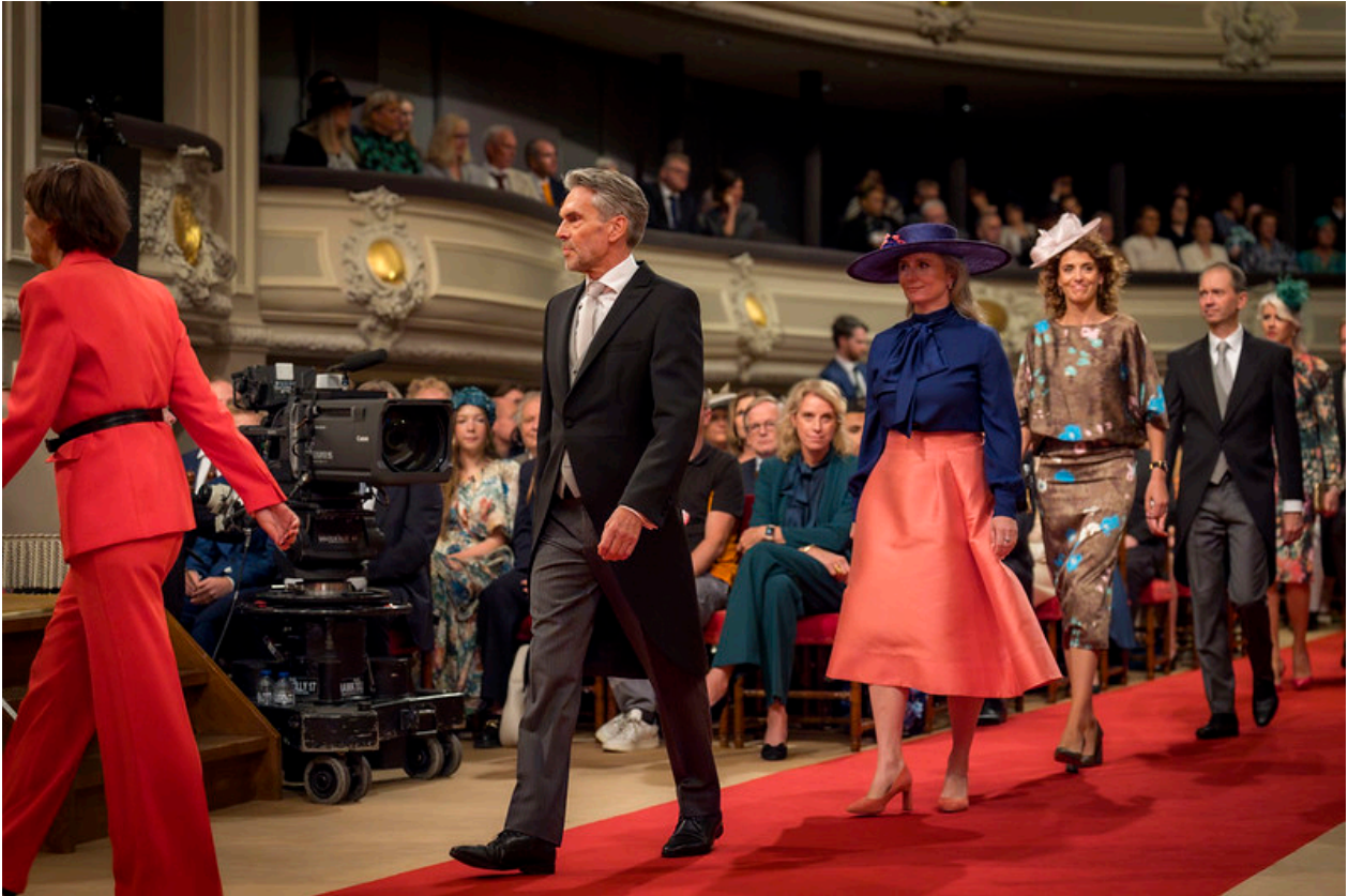
Minister-president Dick Schoof arriveert in de Koninklijke Schouwburg in Den Haag

Dit lijkt ons een terechte uitzondering op het begrip aanspraak. De gedupeerden zullen dit ook niet ervaren als een aanspraak, hebben met deze groep beleggers. Het zou wat ons betreft ook ver gaan als alleen voor deze groep beleggers een uitzondering wordt gemaakt.