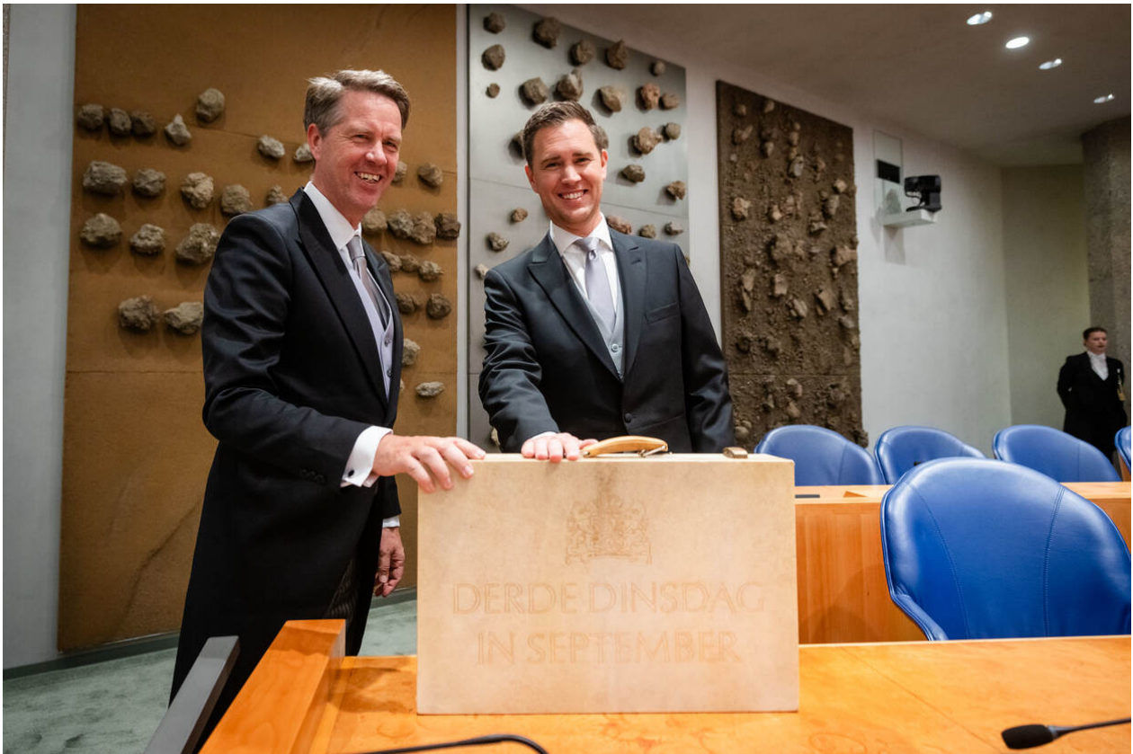
Minister van Financiën Eelco Heinen overhandigt de Miljoenennota aan Kamervoorzitter Martin Bosma.

Regeerprogramma en prinsjesdag: Net als voor lijfrente zijn voor de kapitaalverzekeringen in het Regeerprogramma en in het Belastingpakket 2025 geen voorstellen opgenomen.