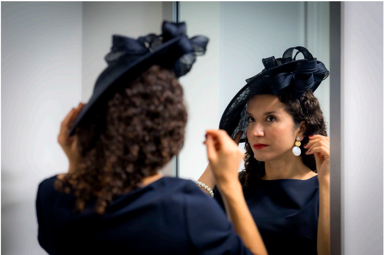
Staatssecretaris van Financiën, Nora Achahbar

Het is niet verrassend dat het onderwerp lijfrente in het Regeerprogramma weinig aandacht krijgt. Vanuit de gedachte dat het rustig moet zijn in het pensioendossier is dat te begrijpen. Kijken we naar de zogenoemde witte en grijze vlekken, verdient de lijfrente wel meer aandacht. En is er meer nodig dan de nu met Prinsjesdag gepresenteerde 'technische aanpassingen'.